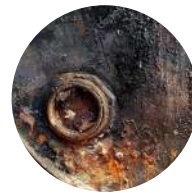
Загрязнения от нефтепродуктов